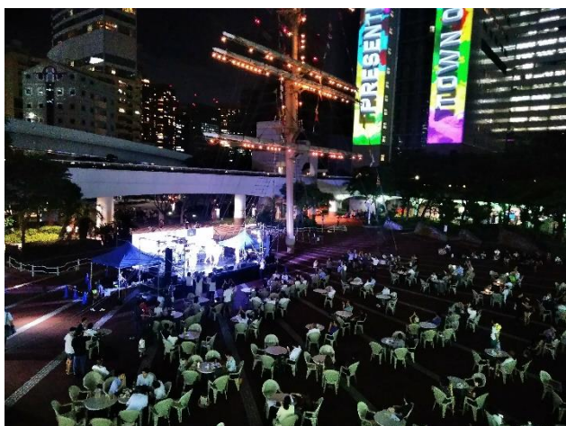
竹芝ふえす 2018 開催の様子

なお、竹芝夏ふえすは、港区が実施する港区ナイトタイムエコノミー補助金 (※3) を活用し実施しています。