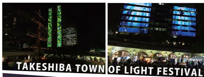
TAKESHIBA TOWN OF LIGHT FESTIVAL

2018年8月22日(水)、23日(木)、24日(金)の3日間、竹芝客船ターミナルのデッキ&広場で、納涼ビアガーデンとして「第4回 竹芝夏ふえす Takeshiba Seaside Dining & Music」を開催しました。同時に「竹芝Town of Light Festival」も開催し、周辺建物へプロジェクションマッピングが映し出されました。また、芝商業高等学校の生徒さんによる音楽、Jazzの演奏、フード&ドリンクと共に楽しんでいただきました。今年度はビールに加え、竹芝オリジナルカクテルも販売しました。台風の影響があったにもかかわらず、多くの皆様にお越しいただき、竹芝での夏のひと時を過ごしていただきました。