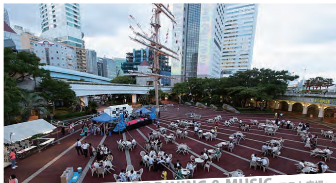
TAKESHIBA SEASIDE DINING & MUSIC～マスト広場～