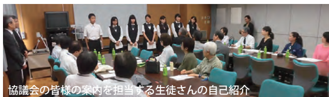
協議会の皆様の案内を担当する生徒さんの自己紹介

毎年芝商業高等学校の1年生を対象として行われる本訓練ですが、見学会を通して、竹芝地区まちづくり協議会の皆様と地域の学生がコミュニケーションを取ることのできる良い機会ですので、今後も継続していきたいと思っております。