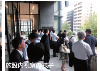
施設内視察の様子