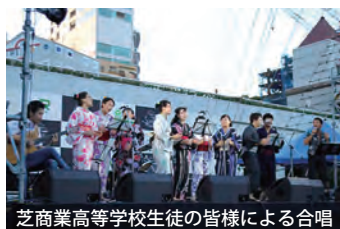
芝商業高等学校生徒の皆様による合唱