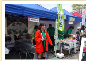
東京都立芝商業高等学校、模擬株式会社「芝翔」のみなさんは福井県池田町のオリジナル商品販売