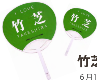
竹芝オリジナル うちわを配布