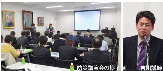
防災講演会の様子