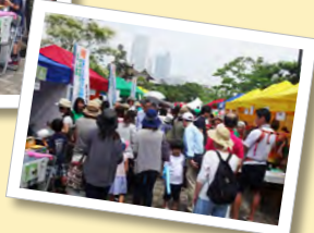
イベントは天候に恵まれ大盛況！