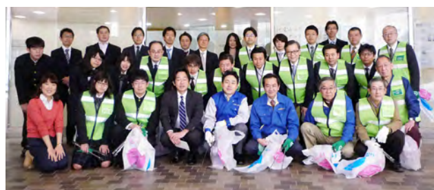
2015年4月の清掃活動は総勢38名で実施しました！