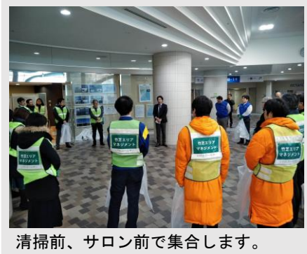
清掃前、サロン前で集合します。